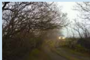
Lågt hängande grenar gör det svårt för slambilen att komma fram