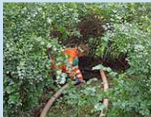
En brunn som är gömd inne i en buske gör det svårt för chauffören att arbeta.

Lätt lock och tydlig placering utan något i vägen gör slamtömmaren glad!